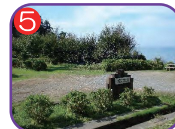
5 大王あじさい園上部駐車場 海拔 37.8m