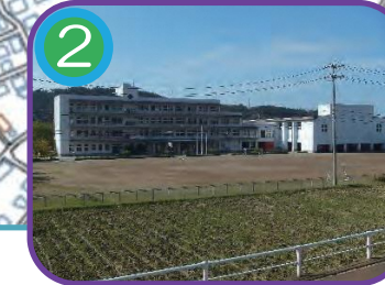
2 能生中学校 (指定避難所) 4階建・海拔 15.0m