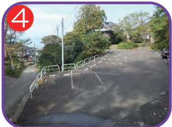
4 実相院駐車場 海拔 29.3m