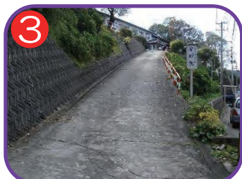
3 金剛院本堂前 海拔 18.8m