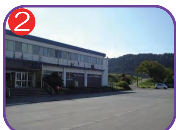
2 能生駅前広場 海拔 11.2m