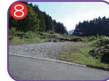
8 笠原建設資材置場 海拔 35.6m