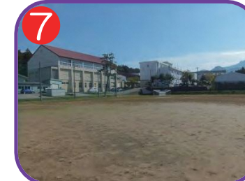
7 海洋高等学校 海拔 37.4m