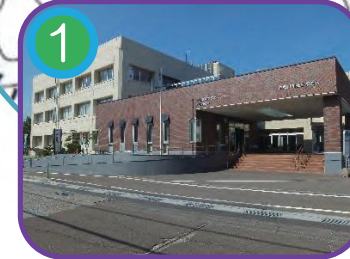
1 能生生涯学習センター (指定避難所) 3階建・海拔 5.0m