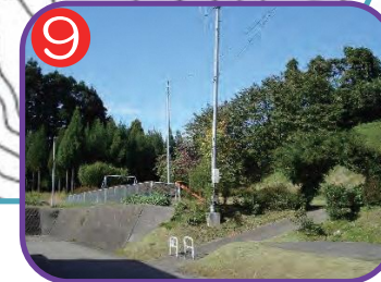
9 丸山児童遊園 海拔 27.9m