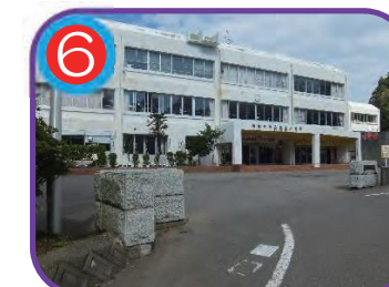
6 能生小学校 (指定避難所) 海拔 21.0m